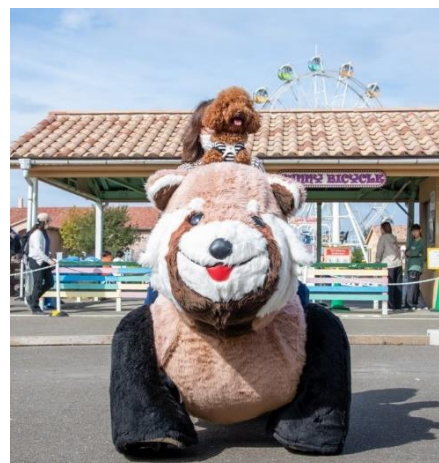
楽しい乗り物にも愛犬と一緒に♪