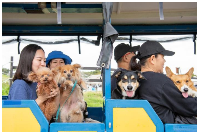
みんなで楽しめるソレイユトレイン