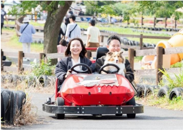
愛犬と一緒に乗れる GOGO カート