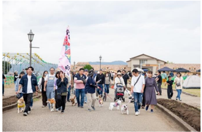
ドッグパレードイメージ 当日は満開の花と一緒に楽しめます！

株式会社日比谷花壇(本社:東京都港区、代表取締役社長:宮島浩彰)は、当社が代表企業を務めるエリアマネジメント横須賀共同事業体で受託し、管理運営を行う「長井海の手公園 ソレイユの丘」(所在地:神奈川県横須賀市)において、愛犬と一緒に楽しめる横須賀市最大級のドッグイベント『SOLEIL DOG PARADE 2025』を、2025年1月25日(土)・1月26日(日)に開催します。