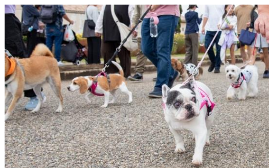
みんなで大行進！ドッグパレード