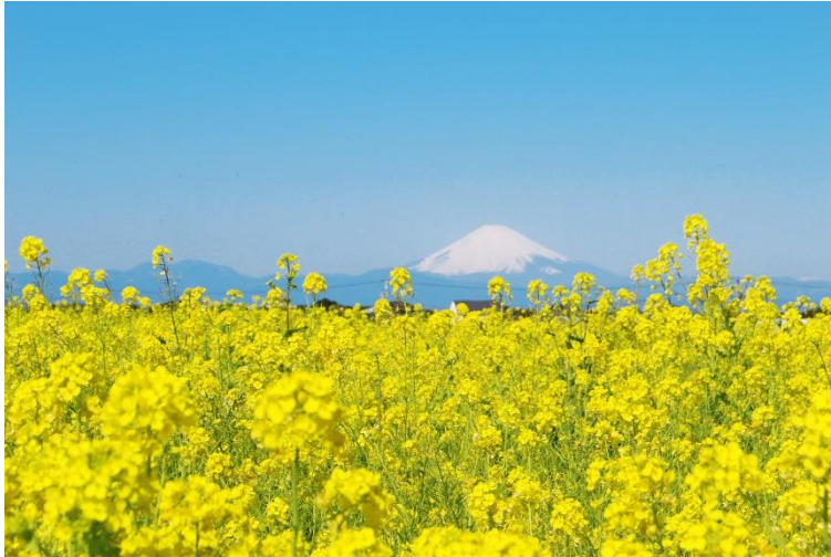
フラワーガーデンウエスト『菜の花畑』