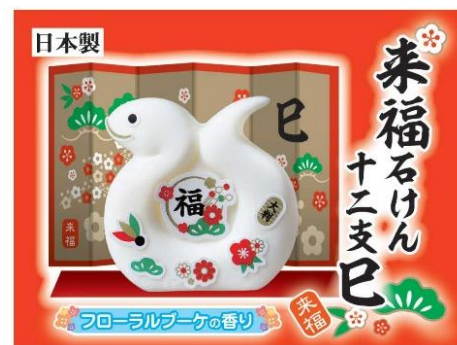
ノベルティ『来福石けん』