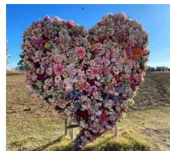
ハート型アートフォトスポット