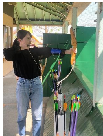
開運『アーチェリー』