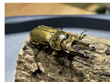
ババオウゴンオニクワガタ