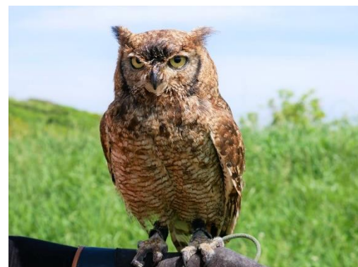
『ゆく年くる年迎春招福イベント！フクロウたちと記念撮影』