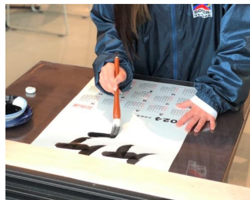
『書初めオリジナルカレンダーづくり』