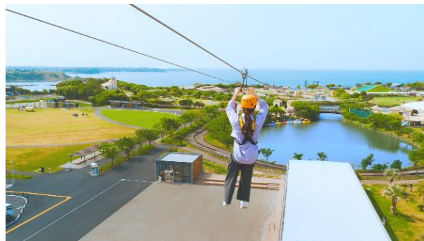
開運『ジップライン』