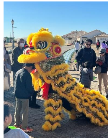
『張海輪雑技団』獅子舞