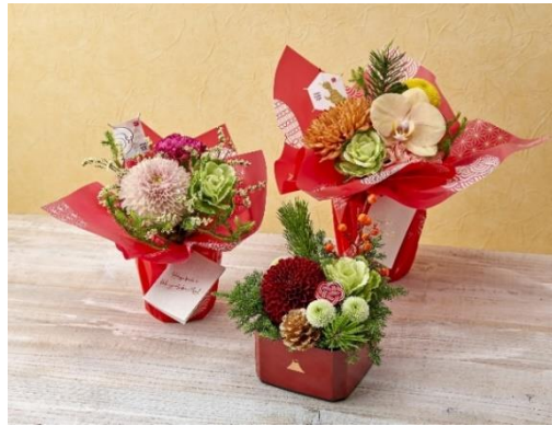
お正月デザインのそのまま飾れる花束とアレンジメント