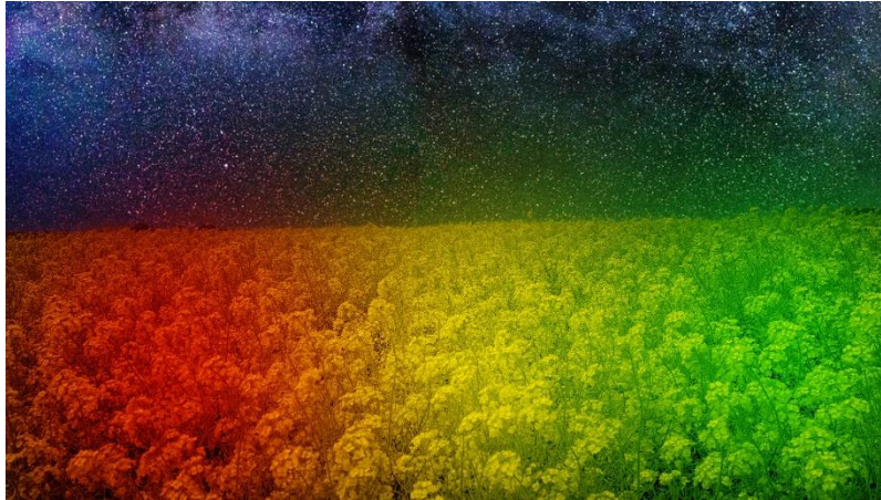
『ソレイユの丘 ナノハナイルミネーション』ライトアップイメージ