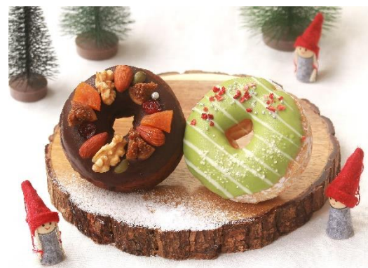
『Xmas リース』『Xmas スノーツリー』