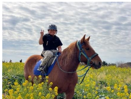
『ナノハナホーストレッキング』

詳細はこちら： https://soleil-park.jp/event/6610