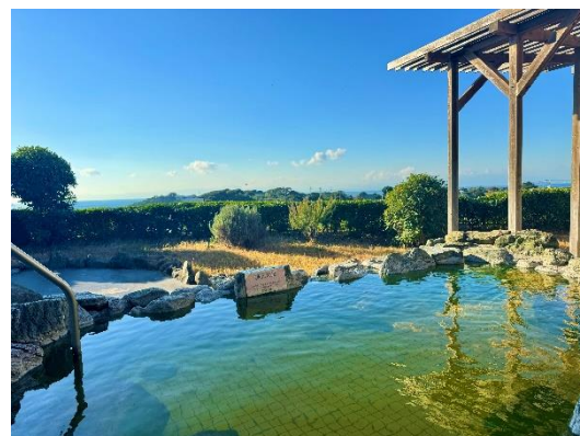
『ナノハナ風呂』イメージ