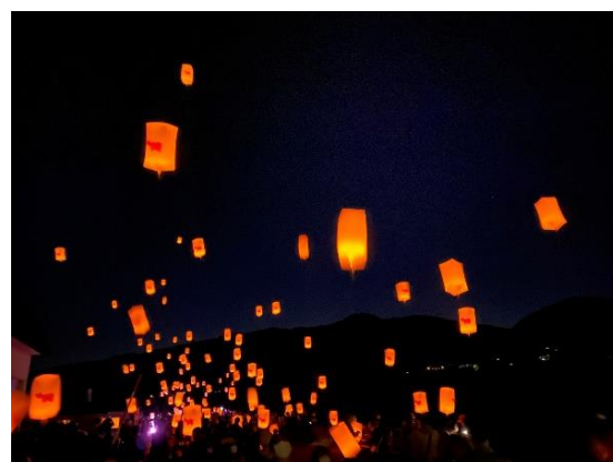
『ランタンフライト』イメージ

詳細はこちら: https://soleil-park.jp/event/6502