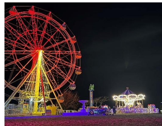
『ナイトアトラクション』イメージ