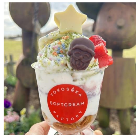
『クリスマスパフェ』