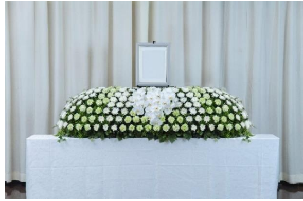
「だれ demo 花祭壇」スタンダードセット ファレノホワイト 180