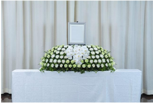
「だれ demo 花祭壇」ショートセット ファレノホワイト 130