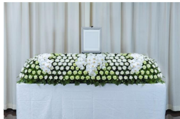
「だれ demo 花祭壇」ロングセット ファレノホワイト 230