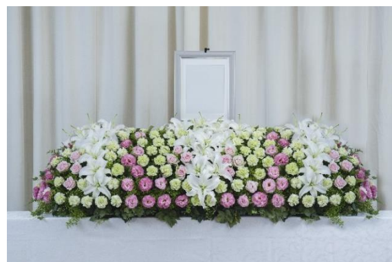
「だれ demo 花祭壇」スタンダードセット リリーピンク 180