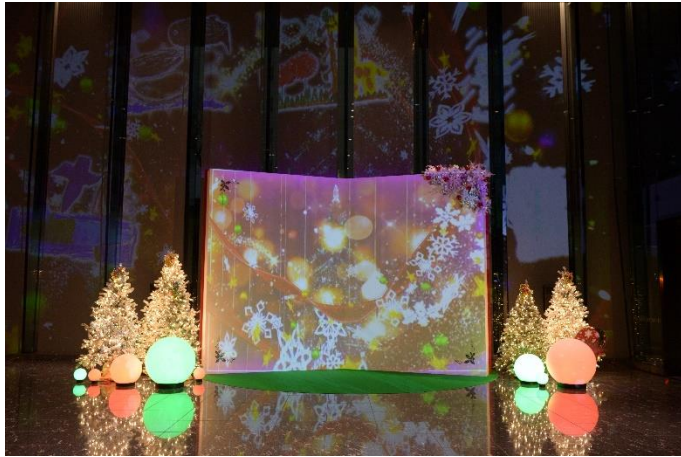
巨大絵本に見立てた大型スクリーン