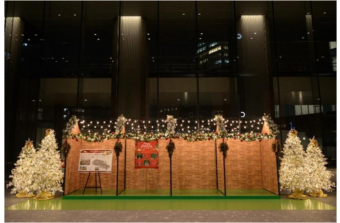
クリスマスイベントブース