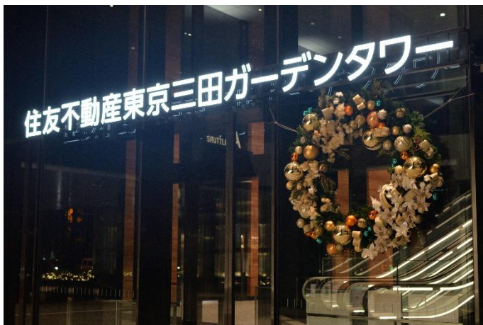
特大クリスマスリース