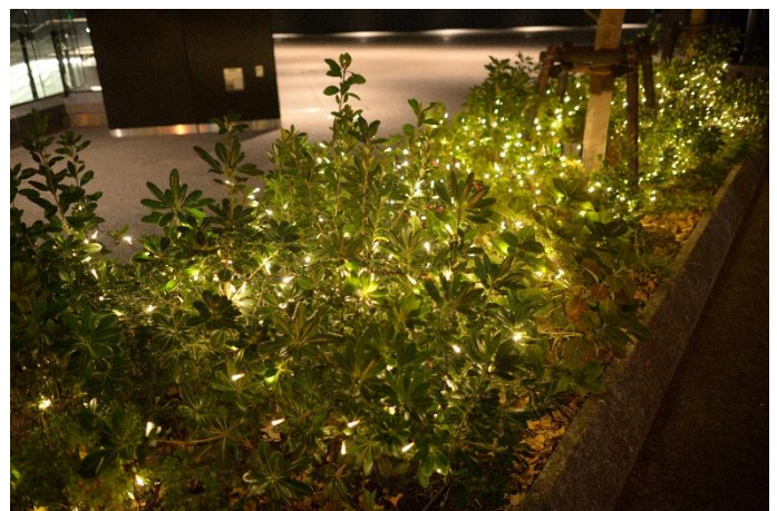
街路樹ライトアップ