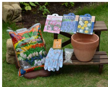
秋植え球根キット(ピンク) 3,675 円