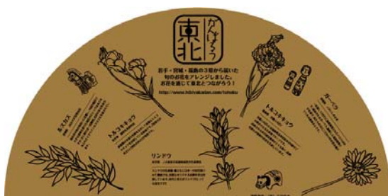
「東北ブーケ」日比谷花壇オリジナルラッピングペーパー〔右:拡大画像〕