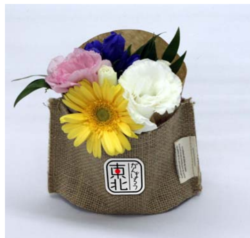
「東北ブーケ」(イメージ)