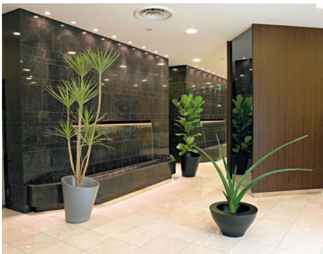
左： ドラセナ・コンシンネ (大鉢) 奥： カシワバゴムノキ (大鉢) 右： サンセベリア・エレナベルギー (中鉢)