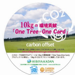
レンタルグリーンの鉢に添付されるタグ

本サービスでレンタルグリーンに付加する排出権は、国連が認証した二酸化炭素削減クレジットCER(Certified Emission Reduction) *4 によるもので、ブラジルの小規模水力発電工場プロジェクトにより創出されたものです。当社から発行する証明書は、カーボンオフセットプロバイダーである株式会社リサイクルワンを通じて、日比谷花壇がオフセット相当分の排出権を購入・償却(日本政府へ寄付)していることを証明するものです。(詳しくは、 http://www.hibiyakadan.biz/ のCO2 排出権付きレンタルグリーンサービスに関する記載をご覧ください。)