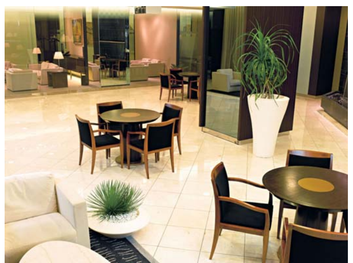
手前：アガベ・ストリクタ (中鉢) 右： タコノキ (大鉢)